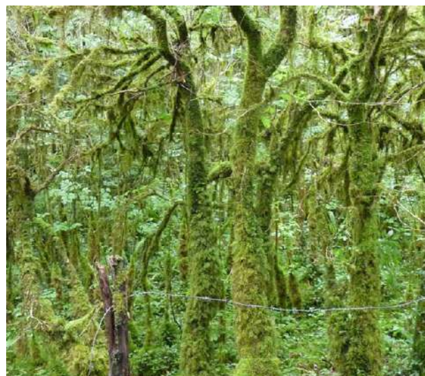
Mousses dans le sous bois.

1h40 7 707441 E - 4775001 N Passer le portail par un petit passage sur la gauche et suivre la route qui part à droite. Au carrefour avec la rue du Touya, prendre à droite pour rejoindre le parking.