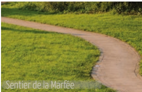
Sentier de la Marfée