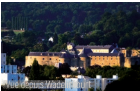
Vue depuis Wadelincourt