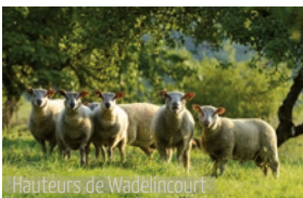
Hauteurs de Wadelincourt