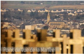
Point de vue de la Marfée