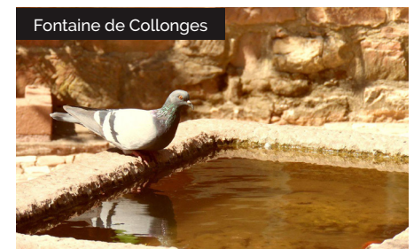
Fontaine de Collonges

8 Au croisement, prendre à gauche vers le lieu dit la Veyrie. Traverser-le. Au croisement prendre à droite. Sur votre gauche sur l'espace de verdure, le lavoire du cimetière Grand. Finir de monter la rue, passer devant le Castel de Maussac . A la D38, tourner à gauche pour rejoindre le point de départ.