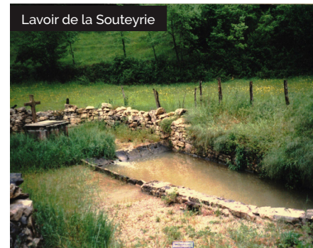
Lavoire de la Souteyrie

Situé sur des sols calcaires donc perméables, le village de Collonges a toujours manqué d'eau. L'eau était captée et acheminée depuis des sources en amont de Collonges jusqu'aux fontaines du village où les habitants venaient se ravitailler car il n'y avait pas d'eau courante jusqu'en 1955. Les lavoirs étaient un véritable lieu de vie sociale où l'on faisait sa lessive. En complément de ce parcours, découvrez le sentier des sources, 6km, qui conte l'histoire de l'eau avec des témoignages sur les péripéties des habitants grâce à l'application www.sentier-des-sources.fr , commenté par Pierre Bellemare.