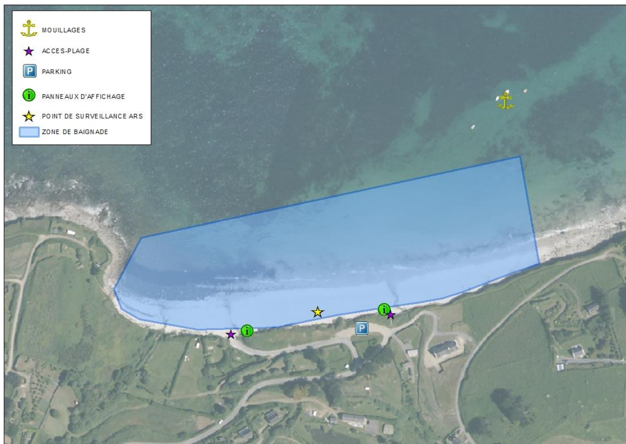
Schéma de la zone de baignade