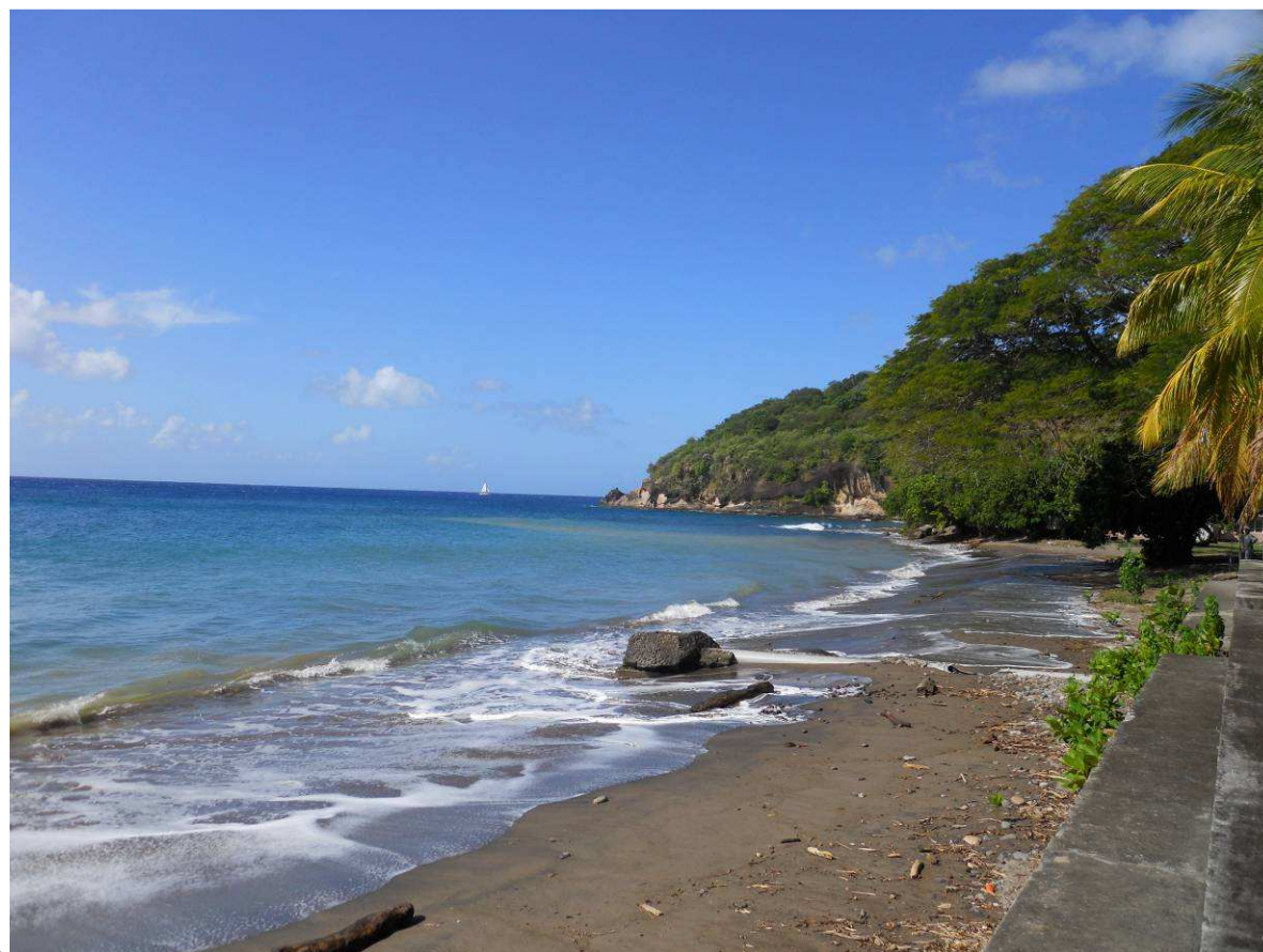
Photo de la zone de baignade

Nom : Vétiver Code plage : 0000000287 Coordonnées géographiques: X=701253, Y=1618614 Commune : Case-pilote Département/Région : Martinique Responsable : Mairie de Case-Pilote Période d'Ouverture : toute l'année Fréquentation : jusqu'à 2000 personnes en période de vacances scolaires (par jour)