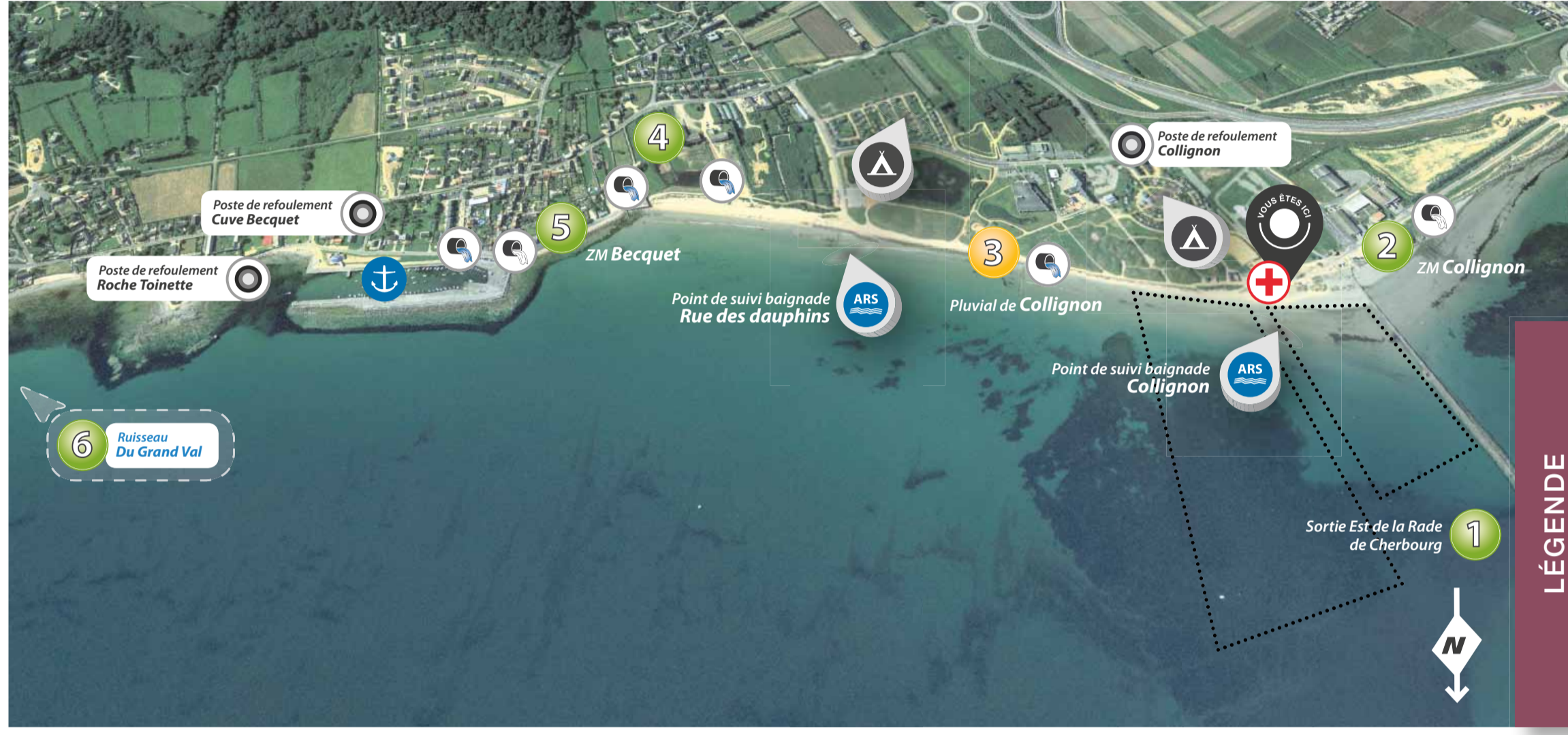
Fond de carte : ORTHO50-2007, Département de la Manche.