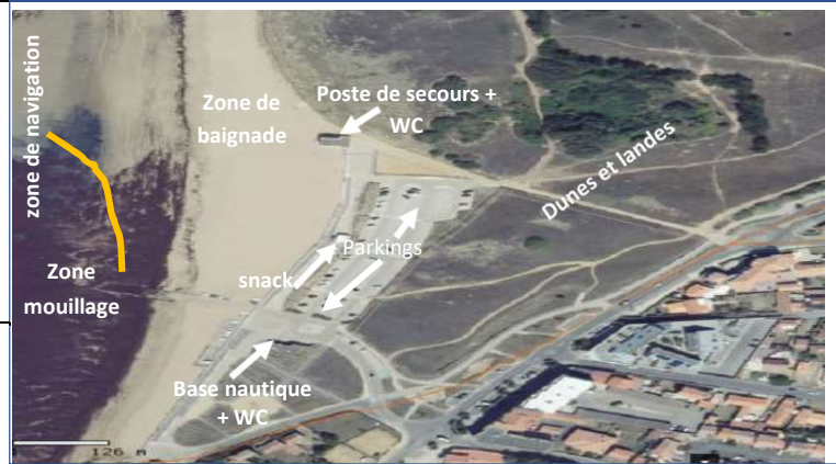
Vue aérienne de la zone de baignade : plage de Sion