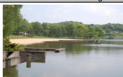
Photo de la zone de baignade

Classement selon la directive 2006/7/CE en vigueur à partir de la saison 2013