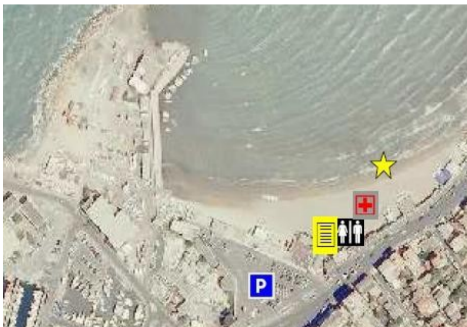
Image de la zone de baignade

En 2022, plage ouverte à la baignade 85,5 jours sur 91. Soit 6,5 jours de fermeture préventive. Taux d'accessibilité de 92,9%.