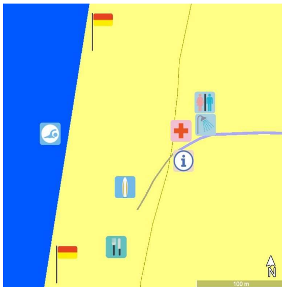
La zone de baignade est placée arbitrairement sur ce schéma.