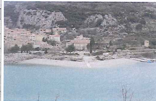
Plage de Bauduen