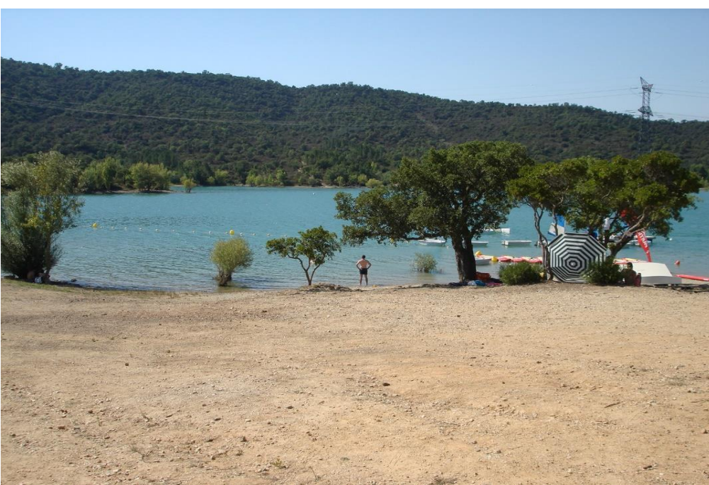
Plage de la Maison du Lac