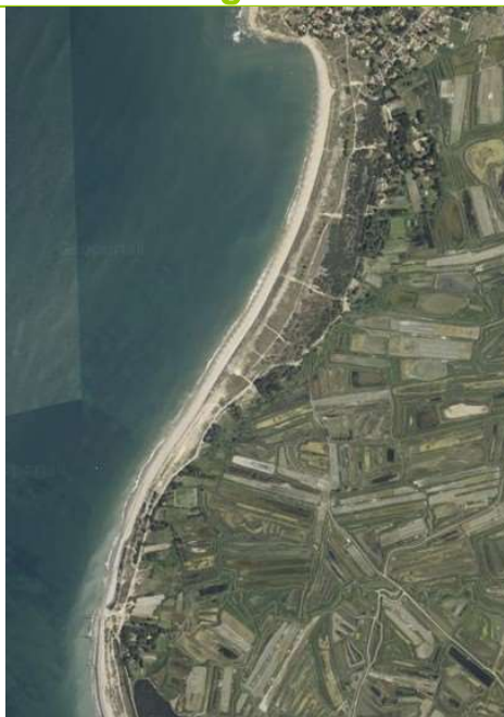
vue aérienne de la plage Luzéronde

Activités pratiquées : baignade, plaisance