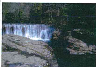
Baignade à l'aval du seuil