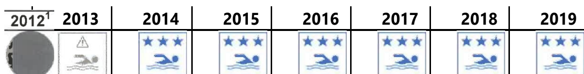
Tableau 1 : Evolution des classements annuels des plages de la zone d'étude