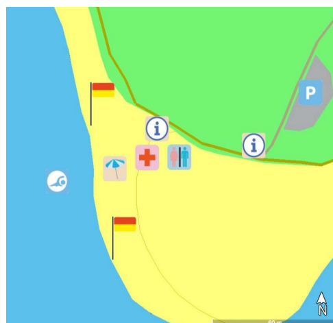
La zone de baignade est placée arbitrairement sur ce schéma.