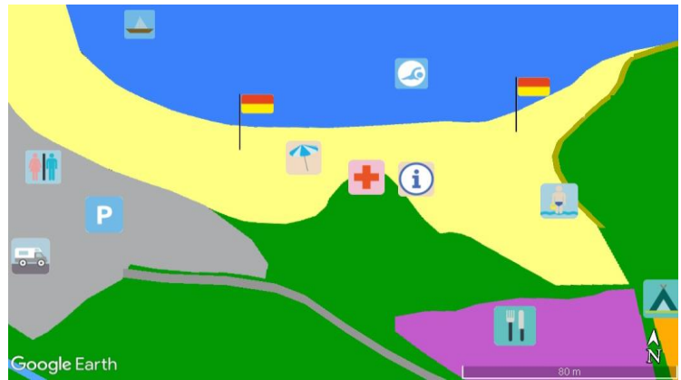
La zone de baignade est placée arbitrairement sur ce schéma.

Activités nautiques, Jeux pour enfants Parking, Point d'eau potable, Poste de secours Restauration, Toilettes, Zone d'affichage