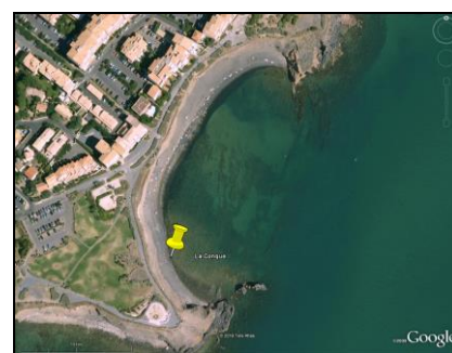
Schéma de la zone de baignade