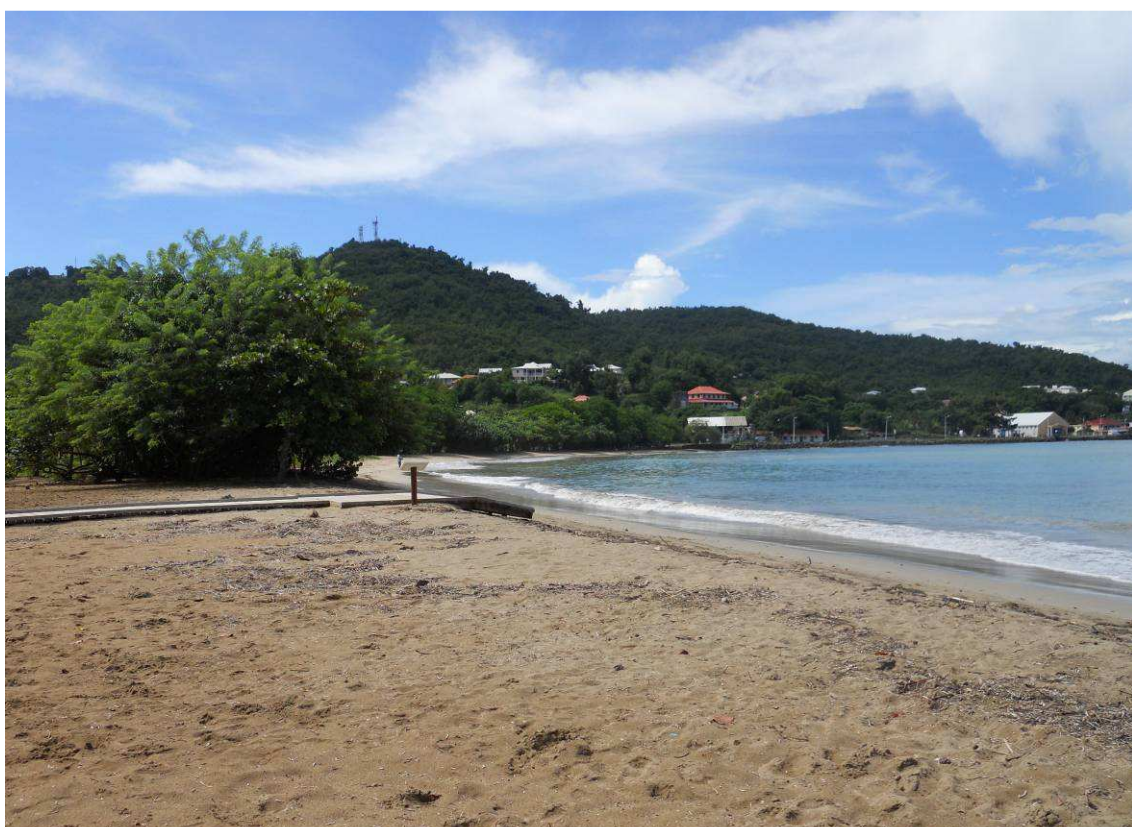
Photo de la zone de baignade

Nom : La Brèche Code plage : 0000000302 Coordonnées géographiques: X= 724837 Y=1633314 Commune : Trinité Département/Région : Martinique Responsable : Mairie de Trinité Période d'Ouverture : toute l'année Fréquentation : 100 à 200 personnes en période de vacances scolaires