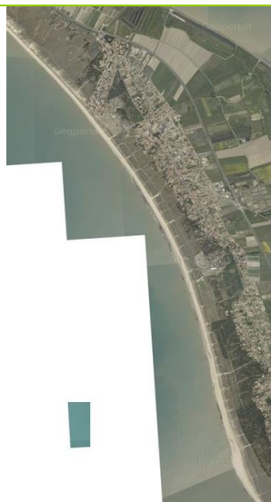
vue aérienne de la plage L'Océan