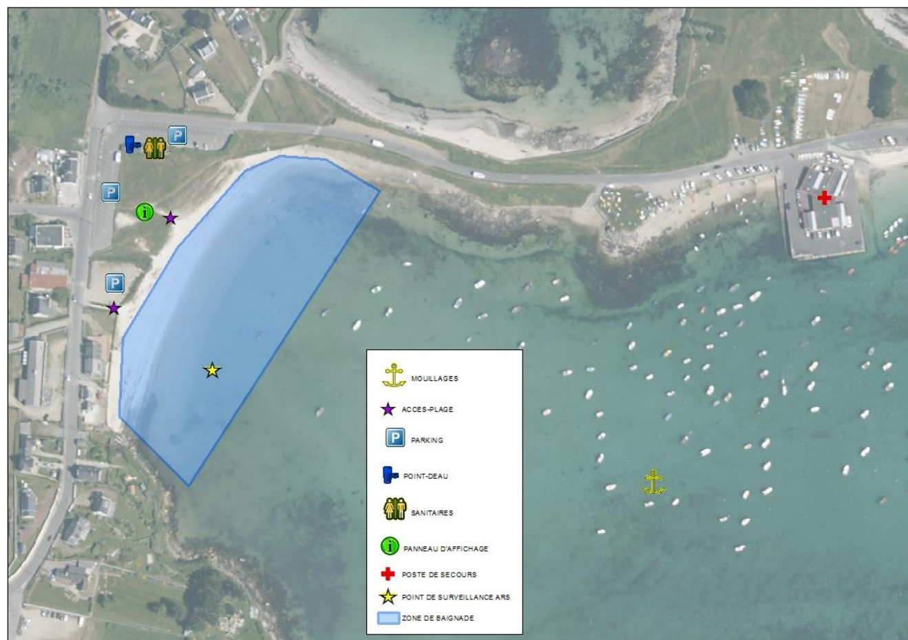
Schéma de la zone de baignade