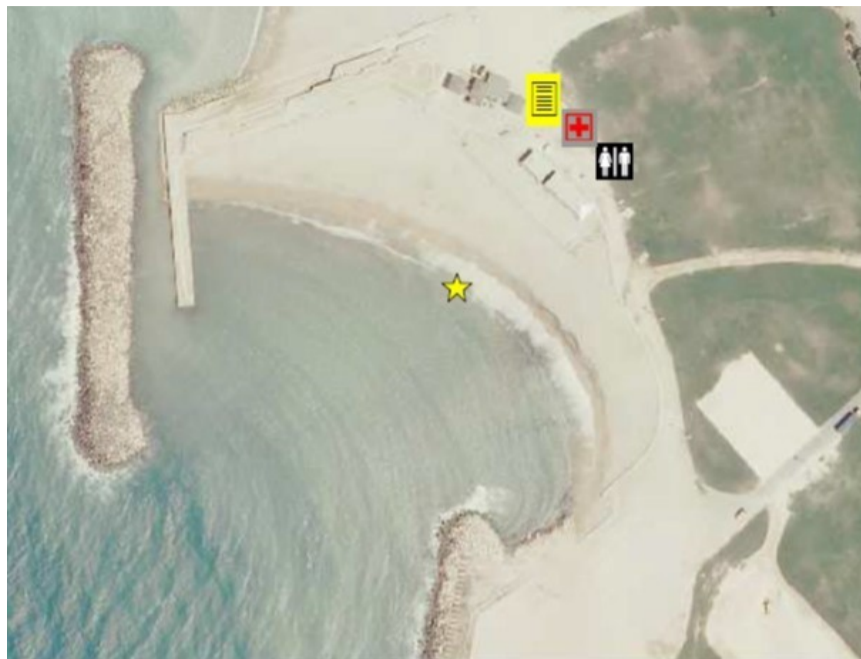
Image de la zone de baignade