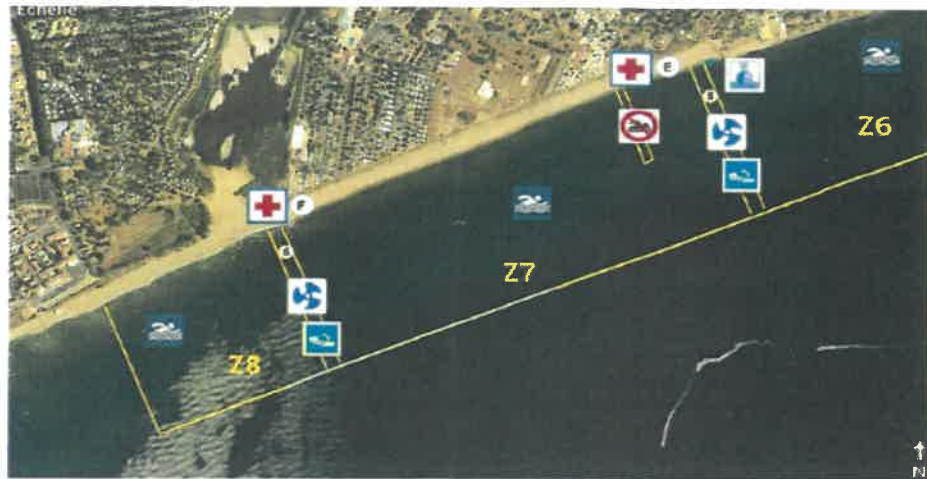
Image de la zone de baignade