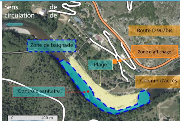
Schéma de la zone de baignade