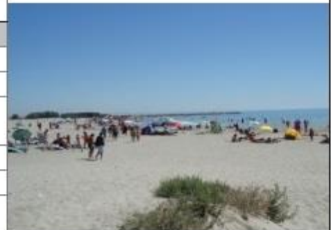
Plage avec baignade surveillée