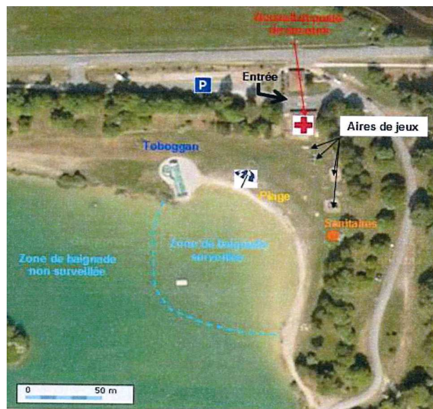
Carte de la zone d'étude

Heures de surveillance : 13h30 – 18 heures