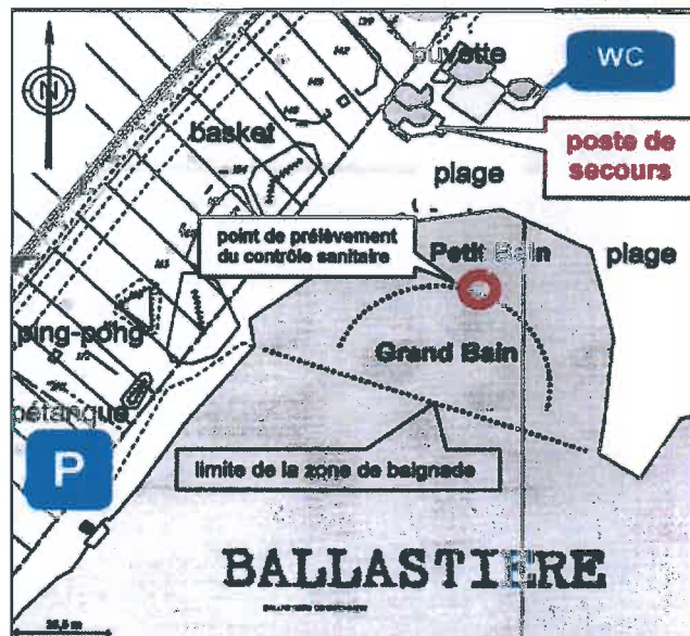
Schéma de la zone de baignade

Nature : Sable, gravier Longueur : 50 m Largeur : 110 m Responsable de l'eau de la baignade : M. le Maire de la Ville de Bischheim Saison balnéaire : Weekends Juin et Juillet-Août Point contrôle sanitaire : X:1001174 Y:2417552 Fréquentation moyenne : 500 baigneurs / jour Equipement : Poste de secours, toilettes H/F Buvette, douche Activités : Baignade, pêche, plongée Accessibilité animaux : Non Environnement : Zone urbaine Occupation du sol : Zone urbanisée - terres arables Jardins familiaux - étangs Population : Bischheim 18.000 habitants (+ banlieue Nord de Strasbourg)