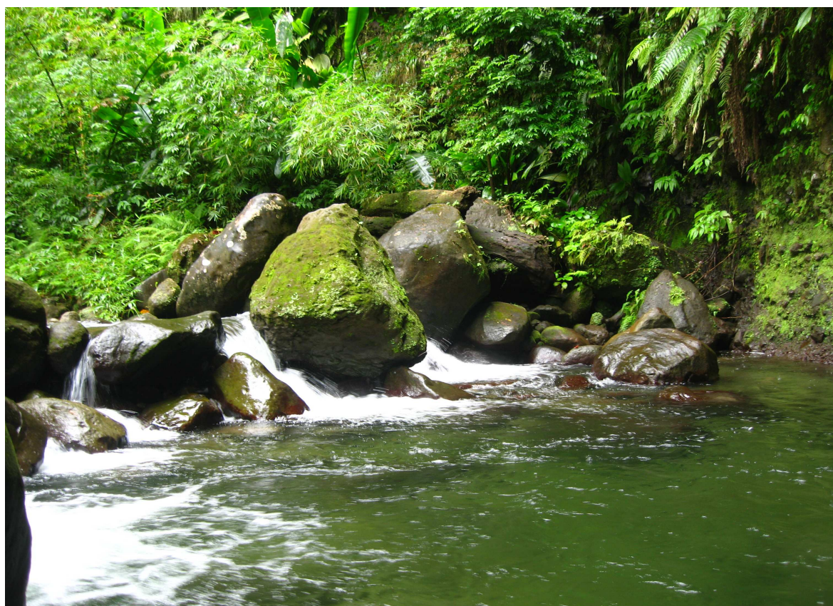
Photo de la zone de baignade

Nom : Amont du Stade Code plage : 0000000339 Coordonnées géographiques : X= 692611 Y=1644738 Commune : Grand-Rivière Département/Région : Martinique Responsable : Mairie de Grand-Rivière Période d'Ouverture : toute l'année Fréquentation : environs 50 personnes en période de vacances scolaires (par jour)